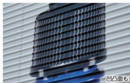
凹凸面もきれいに印刷