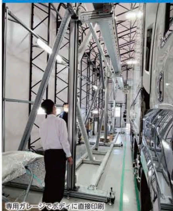
専用ガレージでボディに直接印刷

専用ガレージでの徹底した温度・湿度管理による作業で、美しく耐久性に富んだ、超ハイクオリティな仕上がりを実現